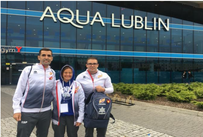
Selección española de natacion