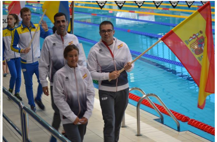
Ceremonia de inauguracion