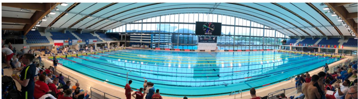
Instalación acuática de la competición