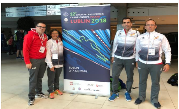
Selección española de natación